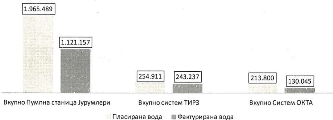
Табела 17: Споредбен приказ пласирана и фактурирана вода во период 01.01 – 30.09.2024 година во тек за четири години